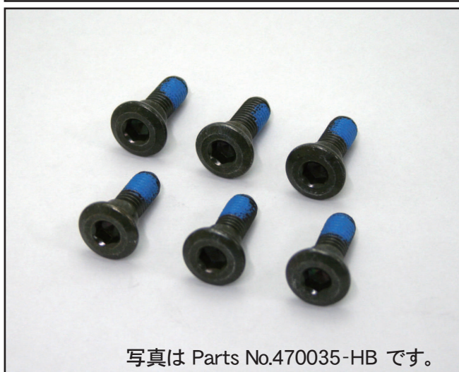
写真は Parts No.470035-HB です。