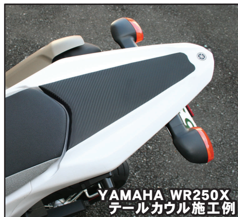
YAMAHA WR250X テールカウル施工例